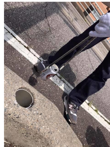
意図的に捨てられたと思われる空き缶