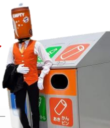
富山応援隊キャラクター 空き缶くん