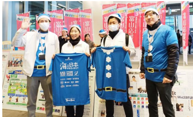
富山マイルート推進協議会の皆様